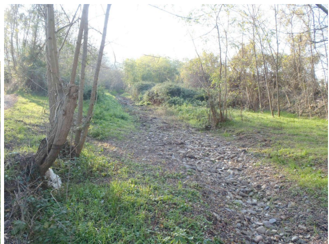
Punto 5. Ponticello per Villa Poschi. Assenza totale di acqua