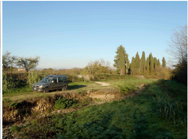
Punto 4. Guado alle Redole. L'acqua inizia ad inalvearsi ed a valle del guado il rio sparisce, rimanendo solo il segno dell'incisione verticale indotta dalle portate di morbida in un ambito artificializzato.