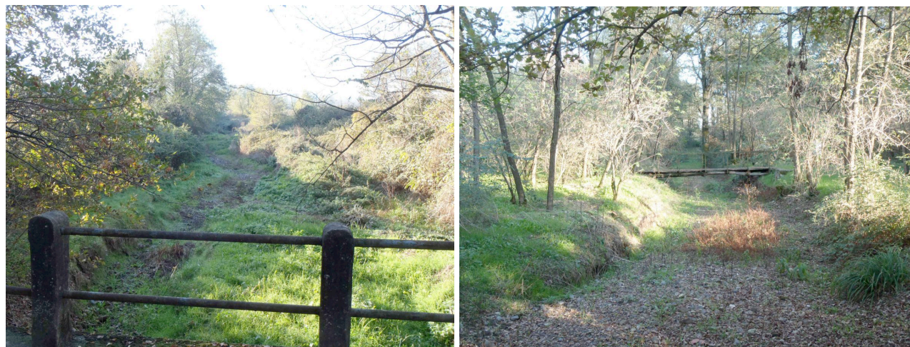
Punto 6. Ingresso ai Bottacci. Anche in questo caso persevera l'assenza di acqua, anche in altri periodi dell'anno.