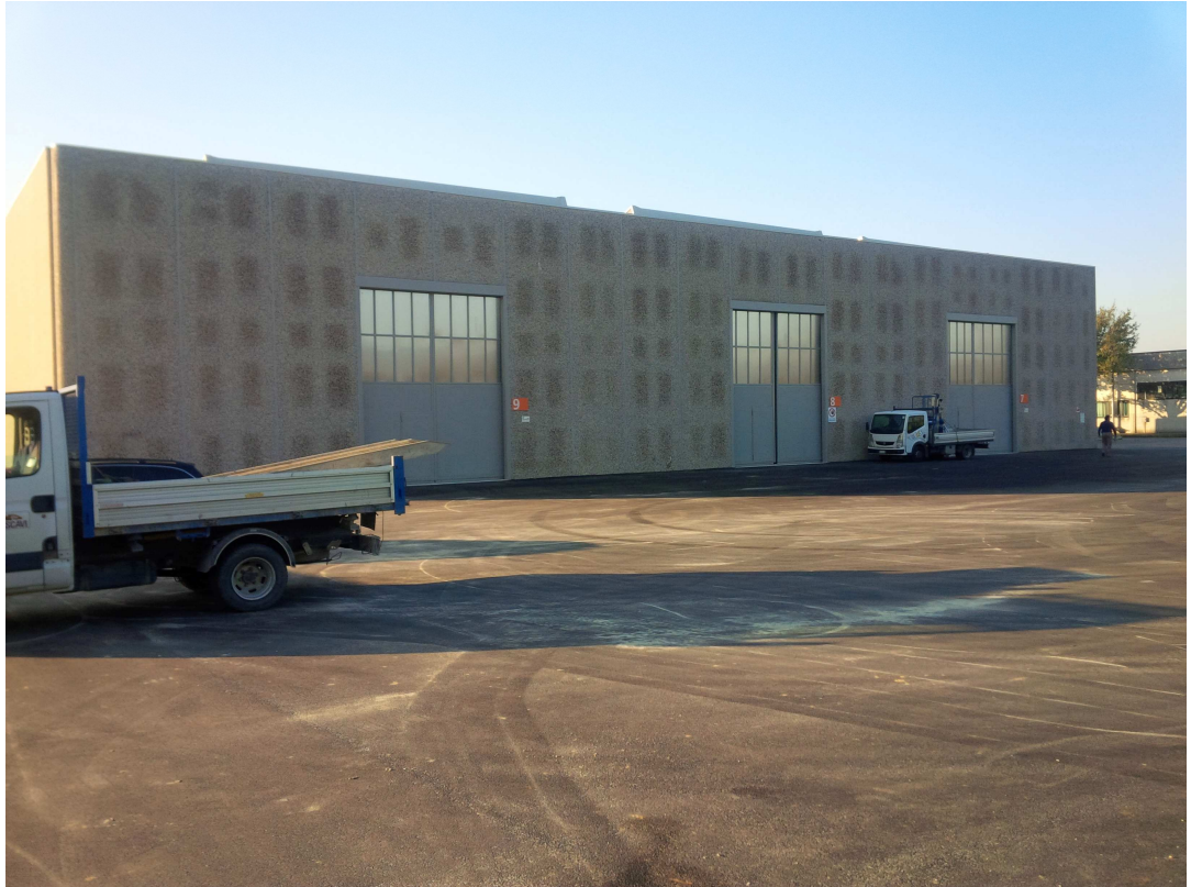
VISTA 7 – vista nord stabilimento