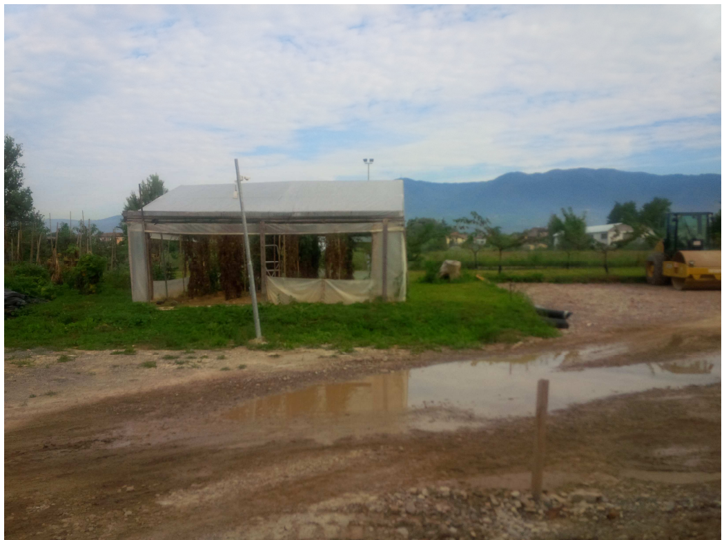
VISTA 10 – nuovo sito della volumetria di progetto