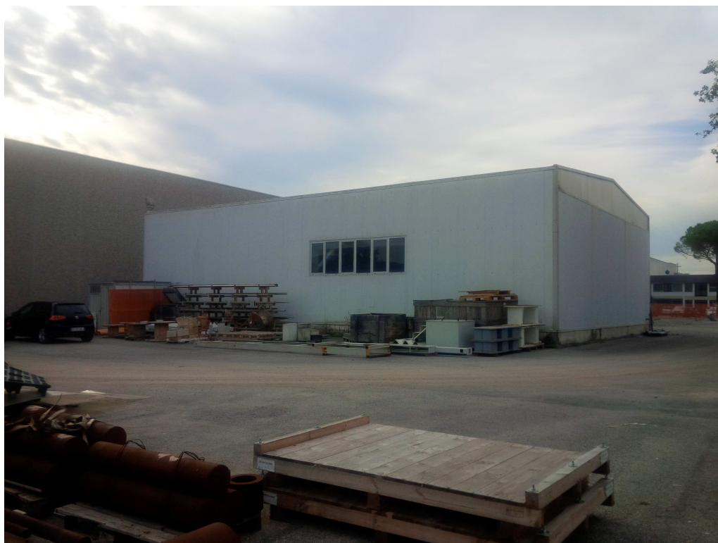
VISTA 6 – vista nord ovest fabbricato oggetto di intervento