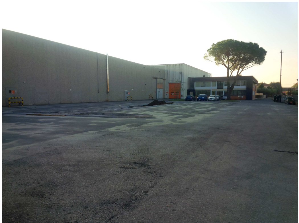
VISTA 4 - zona ovest uffici e stabilimento