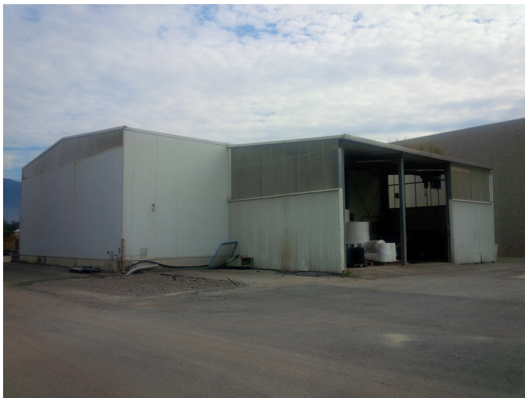
VISTA 5 – vista sud ovest fabbricato oggetto di intervento