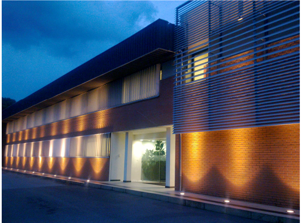
VISTA 3 - ingresso uffici