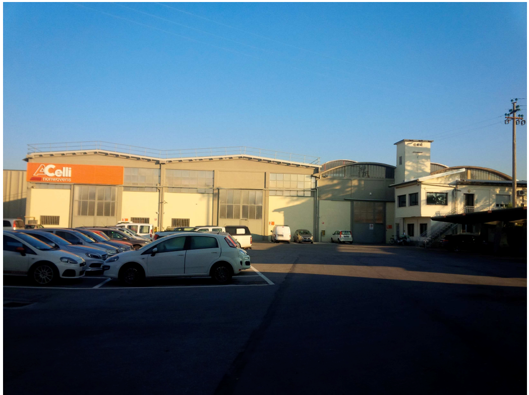
VISTA 1 - ingresso principale dello stabilimento