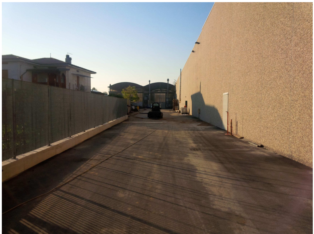
VISTA 8 – lato est stabilimento