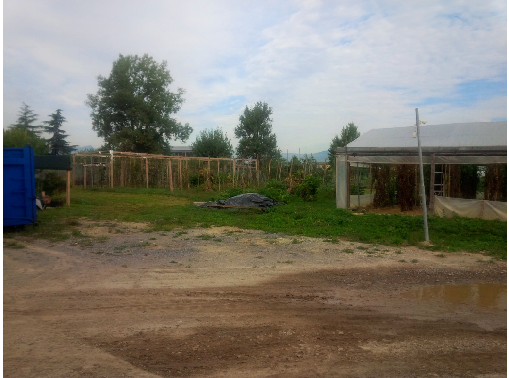
VISTA 9 – nuovo sito della volumetria di progetto