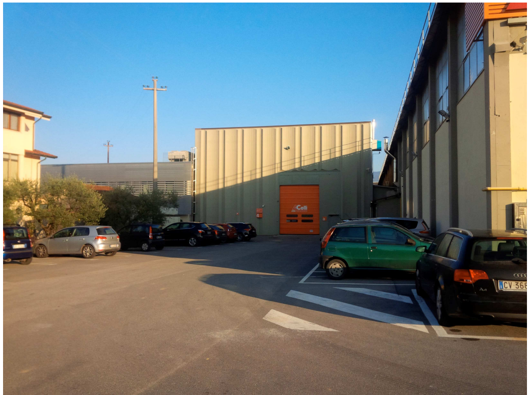
VISTA 2 - zona ingresso magazzino