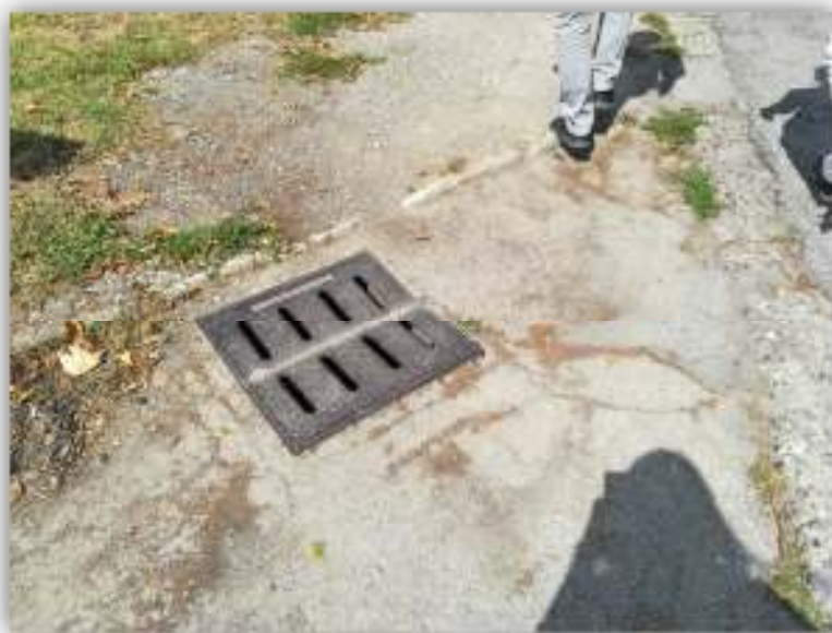
Particolare scolo acque meteoriche in corrispondenza di passo carrabile