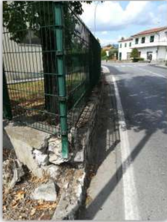
Muretto di recinzione da demolire e ricostruire adiacente al marciapiede