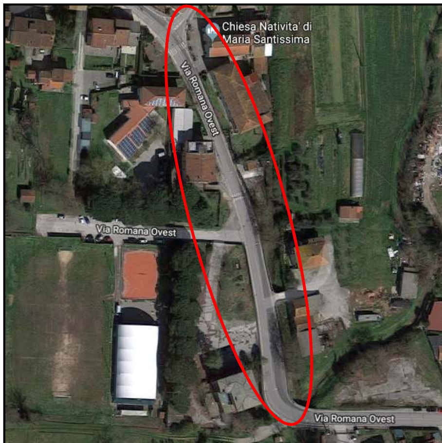
Tratto Via Romana Ovest