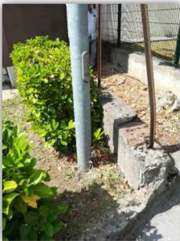
Palo di illuminazione da spostare