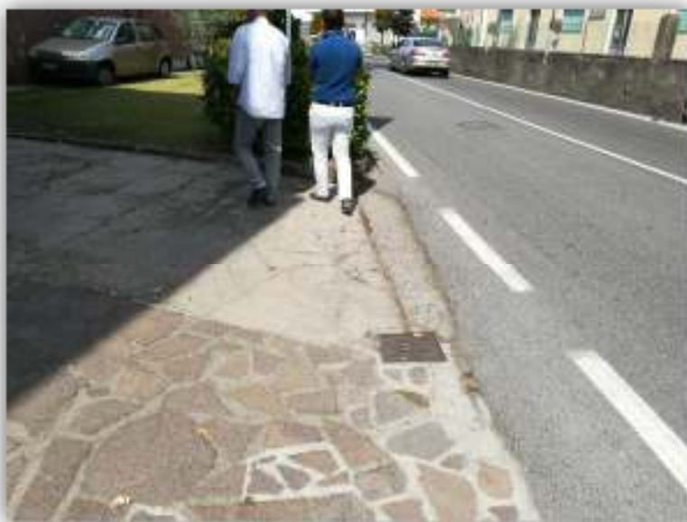
Griglia raccolta acque in corrispondenza di passo carrabile privato