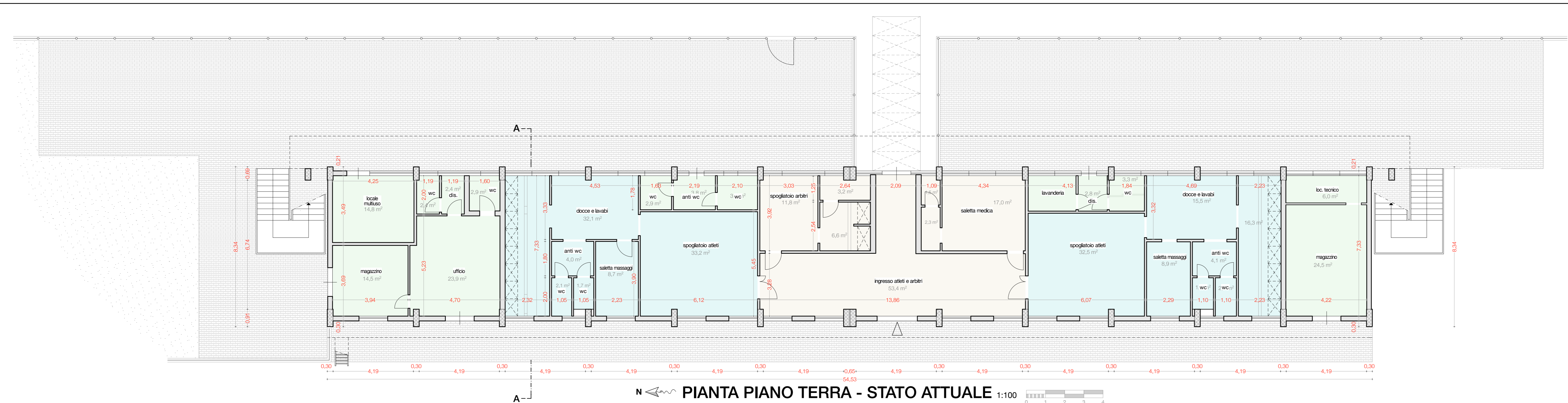
PIANTA PIANO TERRA - STATO ATTUALE 1:100