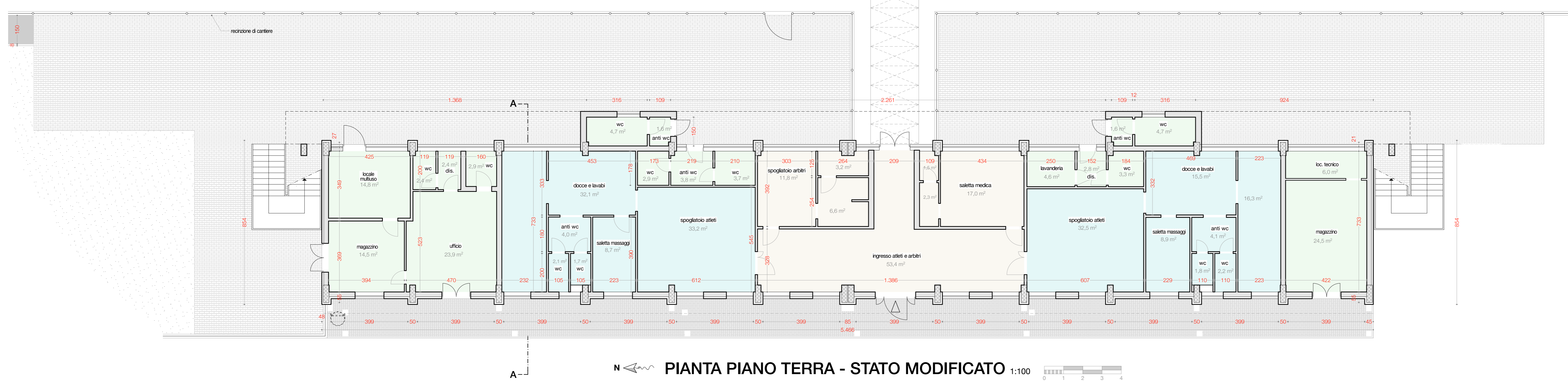
PIANTA PIANO TERRA - STATO MODIFICATO 1:100